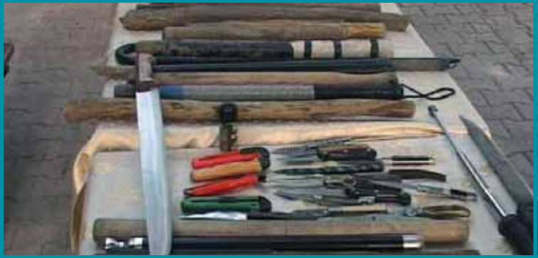
Resim 2. Bir Kavga Sonrası Toplanan Malzemeler; Satır, Döner Bıçağı, Falçata, Kama, Çakı vb.

değil, arkası- kullanılarak kavga edilmektedir. Ayrıca kavga esnasında silah bulundurulacaksa bu ya tayfanın başındaki gençte ya da onun görevlendirdiği birisinde bulunabilir. Özellikle silah kullanımı, kavganın çıkmaza girdiği durumlarda devreye girmekte ve daha kuvvetli bir caydırıcı güç olarak kullanılmaktadır.