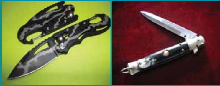
Resim 1. Sustalı ve Ufak Kama Örnekleri

üzerine de belirli mesajlar içermektedir. Gençler çoğu zaman kendi ifadeleri ile “boş gezmek”tedirler. Boş gezmek; en masum hâliyle ufak bir çakıyla sokağa çıkmak demektir. Çakı kullanımının sıradanlaştığı suça dayalı gençlik altkültürlerinde; sustalı, kama, kimi zaman falçata bulundurmamak sıradan bir güvenlik tedbirine dönüşmüş vaziyettedir. Ayrıca özel bir kavga durumu var ise ve iki grup arasında kavganın olacağı önceden kestirilebiliyorsa bu durumda döner bıçağı, satır, kurusıkı ya da ateşli silahlarla kavgaya gitmek söz konusu olabilmektedir.